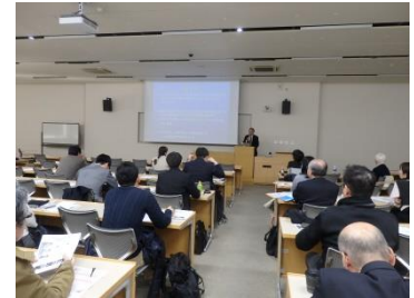
東京プロボノで活動説明