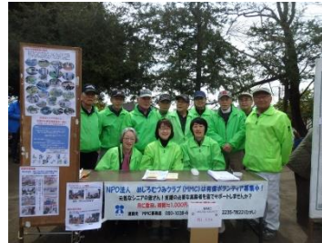
万葉公園桜祭りでPR