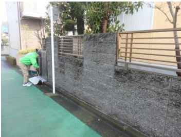
留守宅の道路清掃