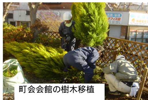
町会会館の樹木移植

作業箇所は延べ21件(前年度は19件)です。金額面では年初計画の130.8%でした。今回も各町会を通しての空地の草刈、処分、町会会館の樹木伐採、植木撤去、剪定、広場の整備作業等。また金額の大幅に増えた理由は町会の防災倉庫の設置です。