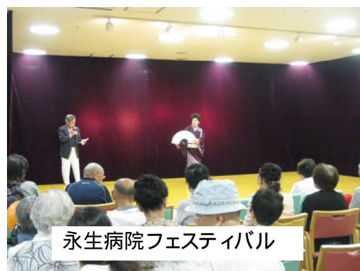
永生病院フェスティバル

10月にはヴァイオリンとピアノのコンサートで会館は満席の90名の鑑賞者、11月中旬には2日間に亘る「趣味の作品展」で285名の来場者、12月初旬に中央大学