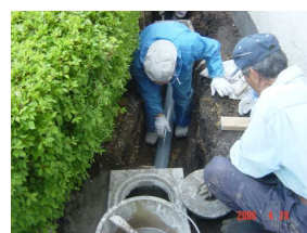
配水管の入替作業

生活支援事業はこれから多忙な時期に入ります。今年も前年より更に前進した活動にしようと思っておりますが、作業員の高齢化が進み人手不足の状況ですので、作業に協力できる方を心からお待ちしております。何かしたいと思う方、経験は不要ですのでお気軽に事務局までご連絡下さい。