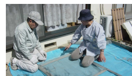
網戸の張替え作業

今年度も会報を3回発行する計画です。会報に対するご意見・アドバイスなどをお待ちしております。