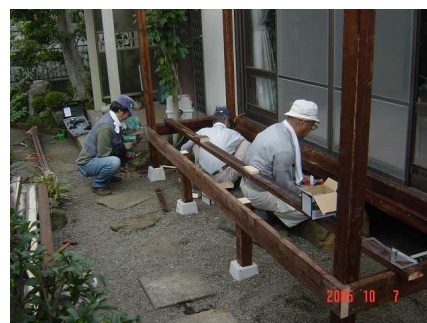
ウッドデッキの製作

日常生活でお困りのことがあれば何なりと事務局に相談して下さい。サービススタッフが直ちにお伺いして相談させて戴きます。