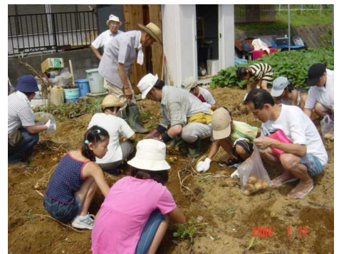
地域交流事業 農園で子供会と芋ほり

* MMCの活動に今まで協力戴いている団体など NPO法人らいふ舎、風の会、めじろデイホーム、 めじろ保育園、めじろ台太鼓、 永生病院、めじろ台2丁目町会、 めじろ台第2むつみ会、めじろ台2丁目祭り同好会